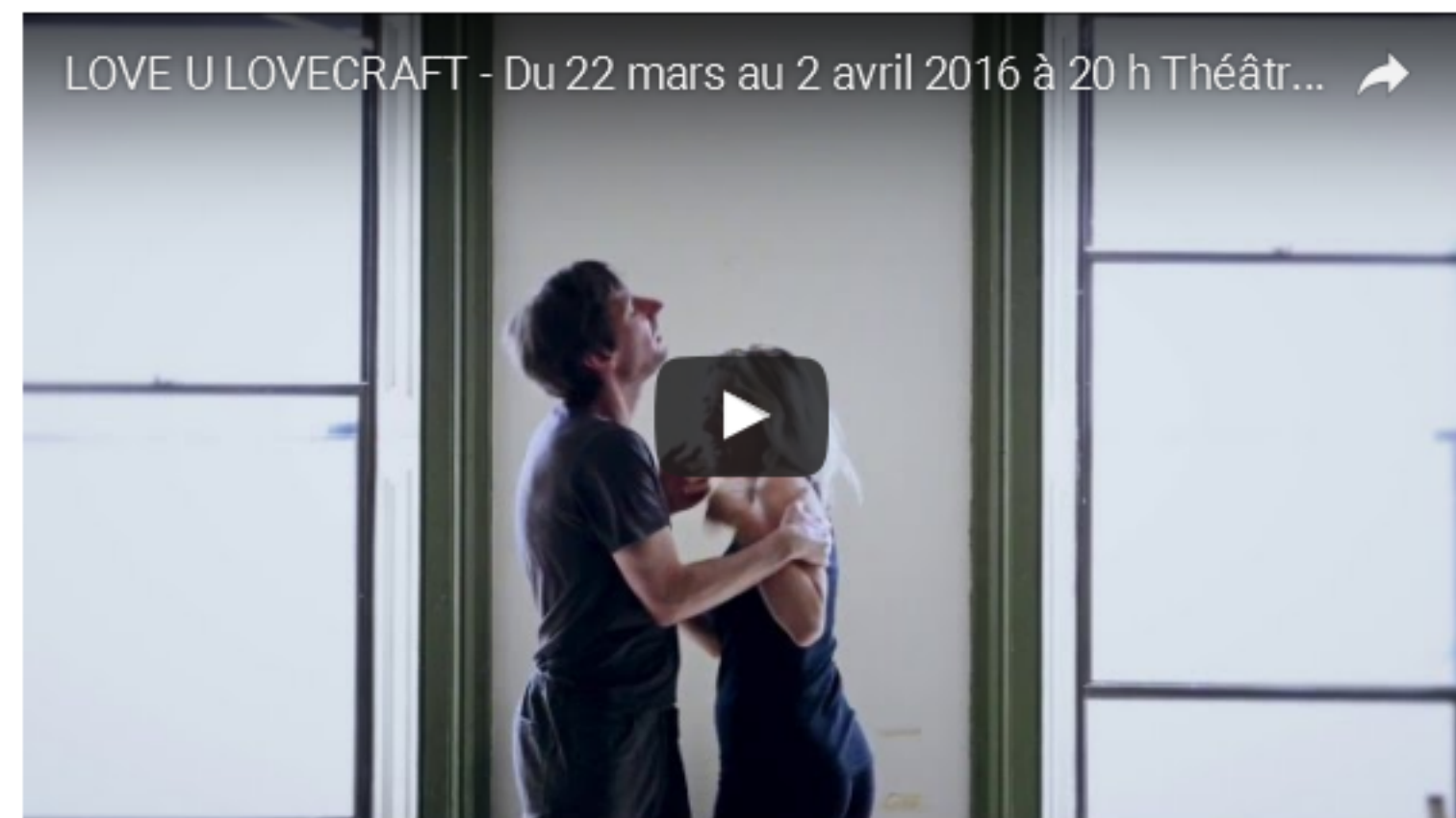
Love U Lovcraft, du 22 mars au 2 avril 2016 à 20h au Théâtre La Chapelle | Scènes Contemporaines, à Montréal.

Dans le décor très réussi de l'intérieur d'une maison autrefois belle mais à moitié démolie, les jeux de lumière sur les acteurs produisent de superbes tableaux aux couleurs harmonieuses. La pièce est d'une esthétique impeccable, tant du point de vue visuel que de la poésie des textes et des musiques choisies. Parvient-elle à faire ressentir la peur que souhaitait apporter Lovecraft à ses lecteurs? Ceci est moins sûr. Mais elle permet quand même une réflexion sur l'étrange et sur l'absence de sens de certains événements de la vie.